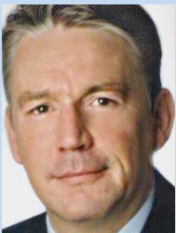
Hans Wulff Kirchner Solar Group GmbH