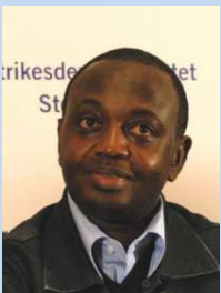
René Ngongo Träger des Alternativen Nobelpreises