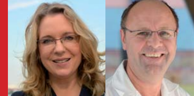
Prof. Dr. Claudia Kemfert